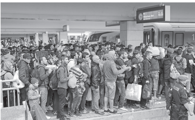
Migranten am Wiener Westbahnhof am 5. September 2015, die zu Tausenden Richtung Deutschland weiterreisen

Deutschland hat sich viele Jahre lang weggeduckt. Wir liegen in der Mitte der EU, umgeben von anderen Mitgliedstaaten, die sich nach dem Dublin-Abkommen um Aufnahme von und Asyl für geflohene Menschen kümmern mussten. Seit das UNHCR eigentlich gar kein Geld mehr für den Anteil der 60 Millionen 1 gewaltsam Vertriebener hat, um die es sich kümmern soll und will, findet eine kleine Völkerwanderung in die EU statt. Dafür sind wir und andere Industriestaaten verantwortlich, auch, aber nicht nur, weil wir versprochene Zahlungen an die UN nicht geleistet haben. 2