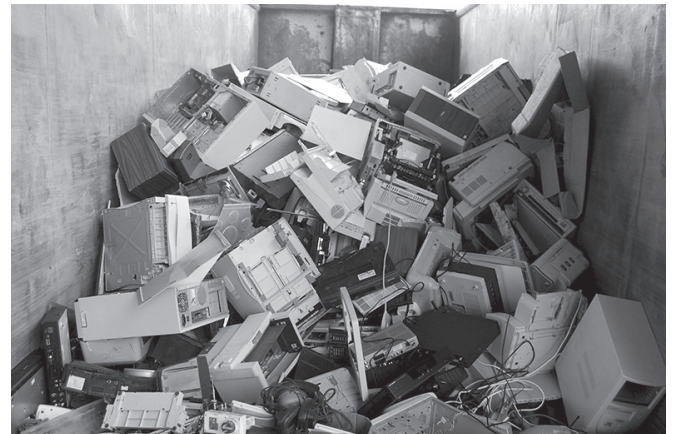
Gut gefüllter Container am „Wertstoffhof“, Foto: dokumol

Den größten nachhaltigen Effekt hat jedoch die Verlängerung des Hardwareeinsatzes. Deshalb sollte vorab immer geprüft werden, ob bereits vorhandene Endgeräte weiterbenutzt werden können. Dafür bietet sich unter Umständen auch eine Auf- oder Umrüstung der Hardware an. Ebenfalls sollten diesbezüglich beim Kauf Geräte bevorzugt werden, welche robust und reparierfähig bzw. modular erweiterbar sind (vgl. Lübberstedt 2016, S. 32). Aus diesem Grund sollte vorrangig auch wiederaufbereitete Hardware bezogen werden. Denn durch den Erwerb der sogenannten Refurbished -Geräte werden die negativen Auswirkungen in allen Nachhaltigkeitsdimensionen reduziert (vgl. Sühmann-Faul, Rammler 2018a, S. 57).